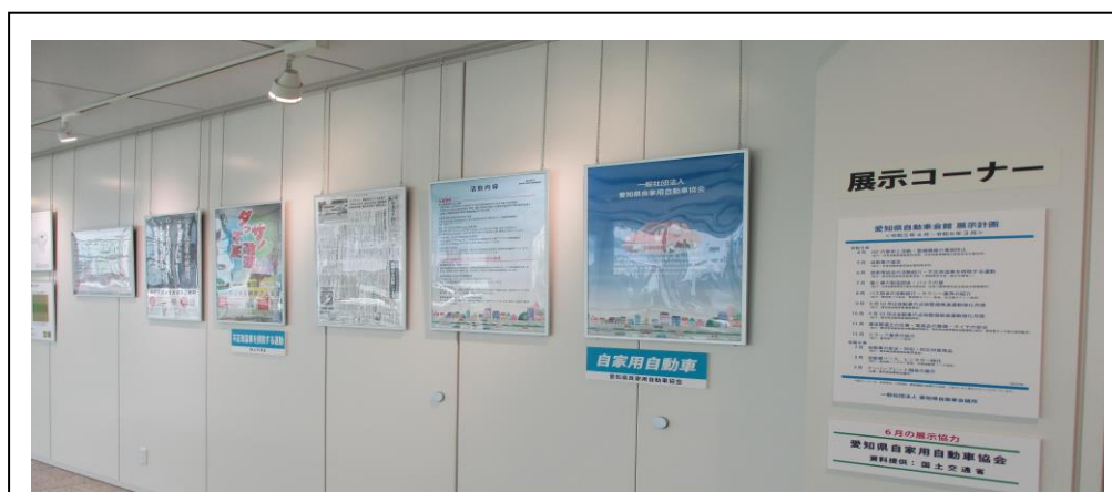
不正改造車を排除する運動のフロア展示（愛知県自動車会館）