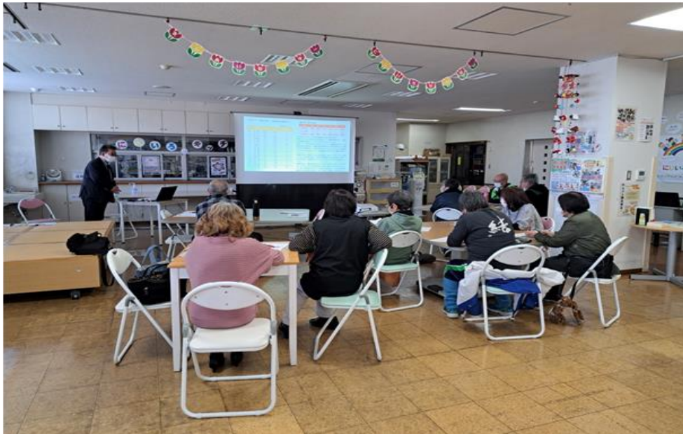
令和6年3月 東浦町社会福祉協議会での交通安全講話

愛知県知多郡東浦町の社会福祉法人「東浦町社会福祉協議会」が開催した交通安全運転講習会のほか、各所の交通安全講習会に赴き交通安全講話を行った。